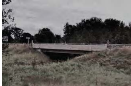
Figure 1 – Photograph of Greenock

piles battered at 1:4 to 1:8. The piles were designed to be 26 feet (7.9 m) long and were driven into very dense silty sand with gravel till. A photograph of the bridge site is presented in Figure 1.