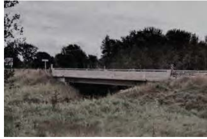
Figure 1 – Photograph of Greenock

une structure à travée unique d'une portée de 17,7 mètres. Les culées existantes sont soutenues par 11 pieux HP310x79 inclinés selon une pente de 1:4 à 1:8. Les pieux, d'une longueur de 7,9 mètres (26 pieds), ont été enfoncés dans un sable silteux très dense, du gravier et du till. Une photographie du site du pont est présentée à la figure 1.